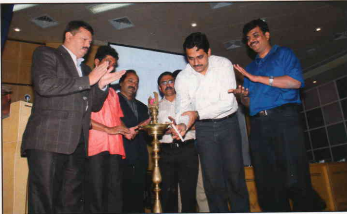
Deputy Commissioner of police (traffic) Manoj Patil Inaugurating the Maharashtra Road Safety Campaign

The Local Road safety Action plan was drawn by Deputy Regional Transport Office, Pimpri Chinchwad and Lokmanya Medical Foundation in collaboration with Traffic Police, Pimpri Chinchwad Municipal Corporation and Shramik Patrakar Sangha, PCMC.