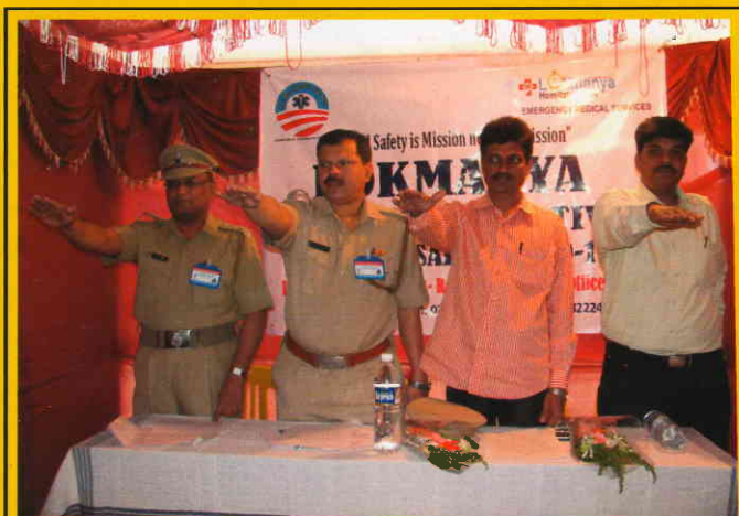
Road Safety Pledge Undertaken on National Road Safety Day

Lokmanya endorsed the Decade of Action Now we need your help to keep up the pressure, to ensure that the promises are followed by real action to make roads safer.