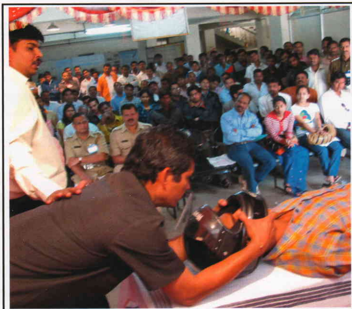
First responder Training Programme