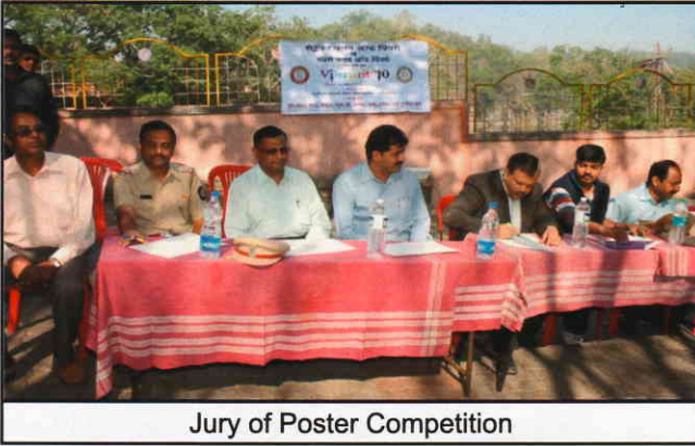
Jury of Poster Competition

Students displayed Display Charts during the pedestrian rally. A role-play will be enacted by a group of students of the colleges. Slogans and captions on Road Safety Awareness were made and distributed to the participants. Awareness about wearing seat belts, not using cell phones while driving, and driver's negligence, high velocity driving and drunken driver was highlighted. A demo on how to give first aid to the accident victims was given by Lokmanya Hospital doctors. Fire brigades' PCMC showcased what one needs to do in emergency fire situations.