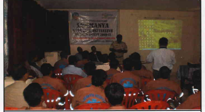
Ambulance Drivers training Programme on 16th Anniversary Day of EMS Lokmanya